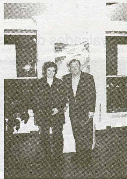
La pintora amb el propietari del "Beauté Club Chatelet" durant l'exposició a París

Fent referència a l'estat de cultura del nostre poble, aquesta roquerola considera que es troba força estancada en quan a activitats, " Hi ha molta gent que té ganes de fer coses.