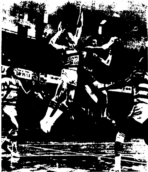
La gran sorpresa de la jornada de baloncesto, correspondiente a la Copa del Rey fue, sin duda, el triunfo del Manresa en la pista del Juventud (83-91). Tras el empate registrado en el partido de ida, el inesperado triunfo de los manresanos deja prácticamente fuera de las semifinales al cuadro de Badalona que, sin embargo, luchó por defender su suerte, como refleja este espectacular salto de Mulá ante el «tapón» de Iradier.