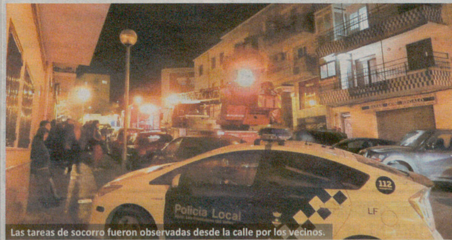
Las tareas de socorro fueron observadas desde la calle por los vecinos.