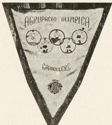
El Banderín Olímpico

Dicha Bendición fué acompañada con una Misa de Comunión a las 8 de la mañana, en la Iglesia Parroquial de