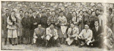
Grupo asistente a la bendición

Seguidamente fué servido un almuerzo de «Germanor» en el notable