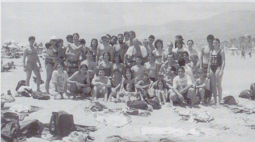
Animeu-vos a fer sortides com aquests intrèpids Xics que van anar a torrar-se al sol