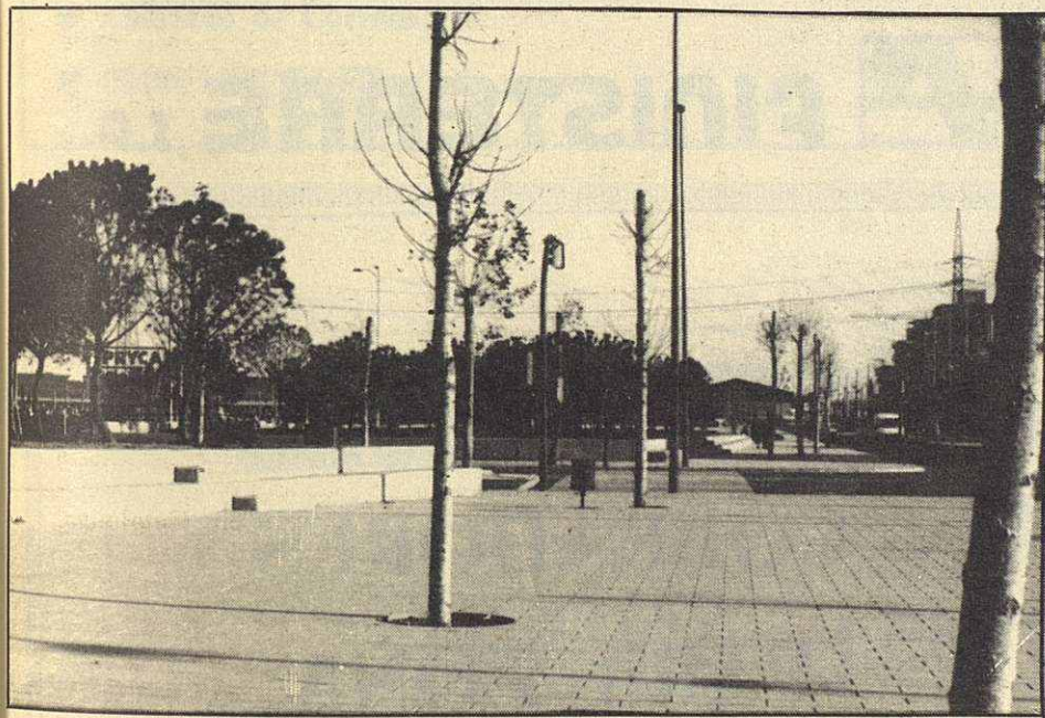
Mollet se beneficiará con nuevos paseos.