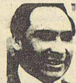
Diputado Gonzalo Machuca, diputado altermo del Chimborazo viajo a Estados Unidos, en gira de turismo y para visitar los organismos internacionales de la OEA y la ONU.