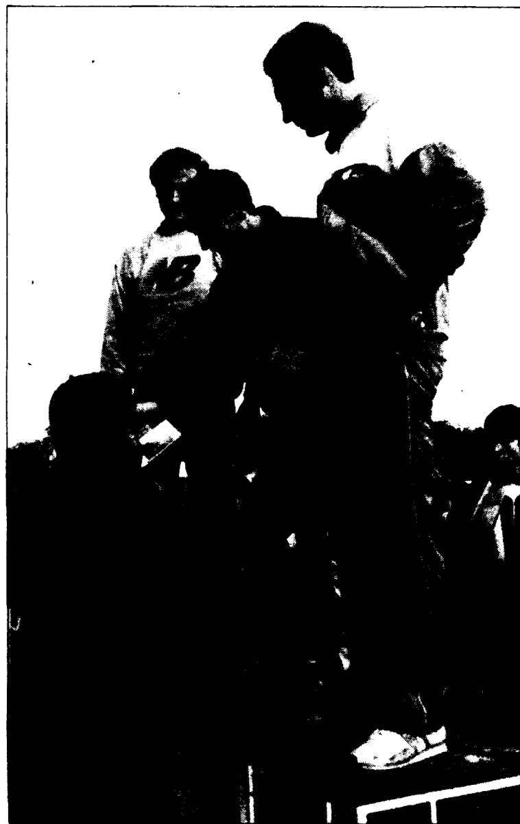
Els guanyadors seniors