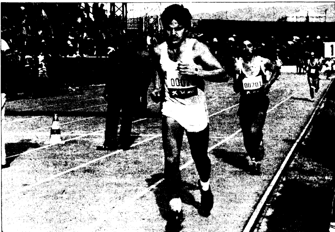
El final de la cursa