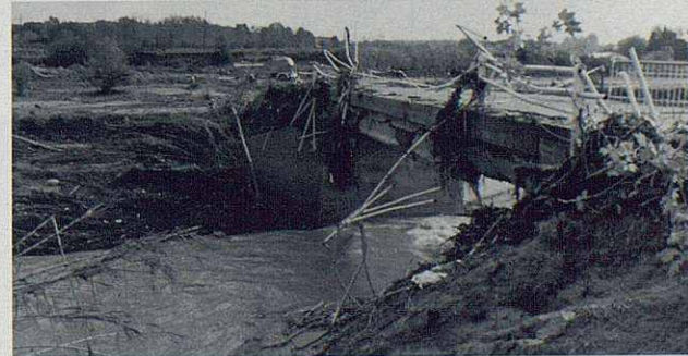
Efectes de la riuada de 1994 al gual de Sant Isidre i al pont de Can Donat.