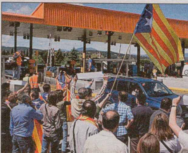
La protesta del pasado domingo tuvo menos convocatoria que las dos anteriores.

O lo planteamos como en Argentina: la nacionalización de las autovías alegando que durante estos cuarenta años ya han tenido suficientes beneficios. Si eso se hiciera, no todos estarían a favor, y no sólo por una cuestión de principios y de la inseguridad jurídica que esto representaría en una economía global. También estarían en contra los pequeños inversores que han adquirido acciones de estas empresas que cotizan en el IBEX-35. El capitalismo popular, la expresión la puso de moda la Gran Bretaña de Margaret Thatcher en la década de los 70, tiene estas cosas: muchos trabajadores tienen una parte de sus ahorros invertidos en bolsa movidos por la perspectiva de la rentabilidad. ¿O es que el afán de lucro es monopolio de los millonarios? La factura de la nacionalización de YPF-REPSOL no la paga Antoni Brufau, el director general que da la cara, sino los miles de grandes y pequeños accionistas que depositaron sus ahorros en esta multinacional petrolera. El simpático y solidario dúo Serrat y Sabina no deben