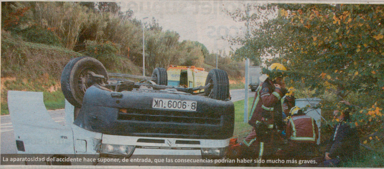
La aparatosidad del accidente hace suponer, de entrada, que las consecuencias podrían haber sido mucho más graves.