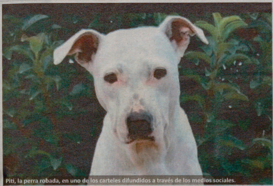
Piti, la perra robada, en uno de los carteles difundidos a través de los medios sociales.