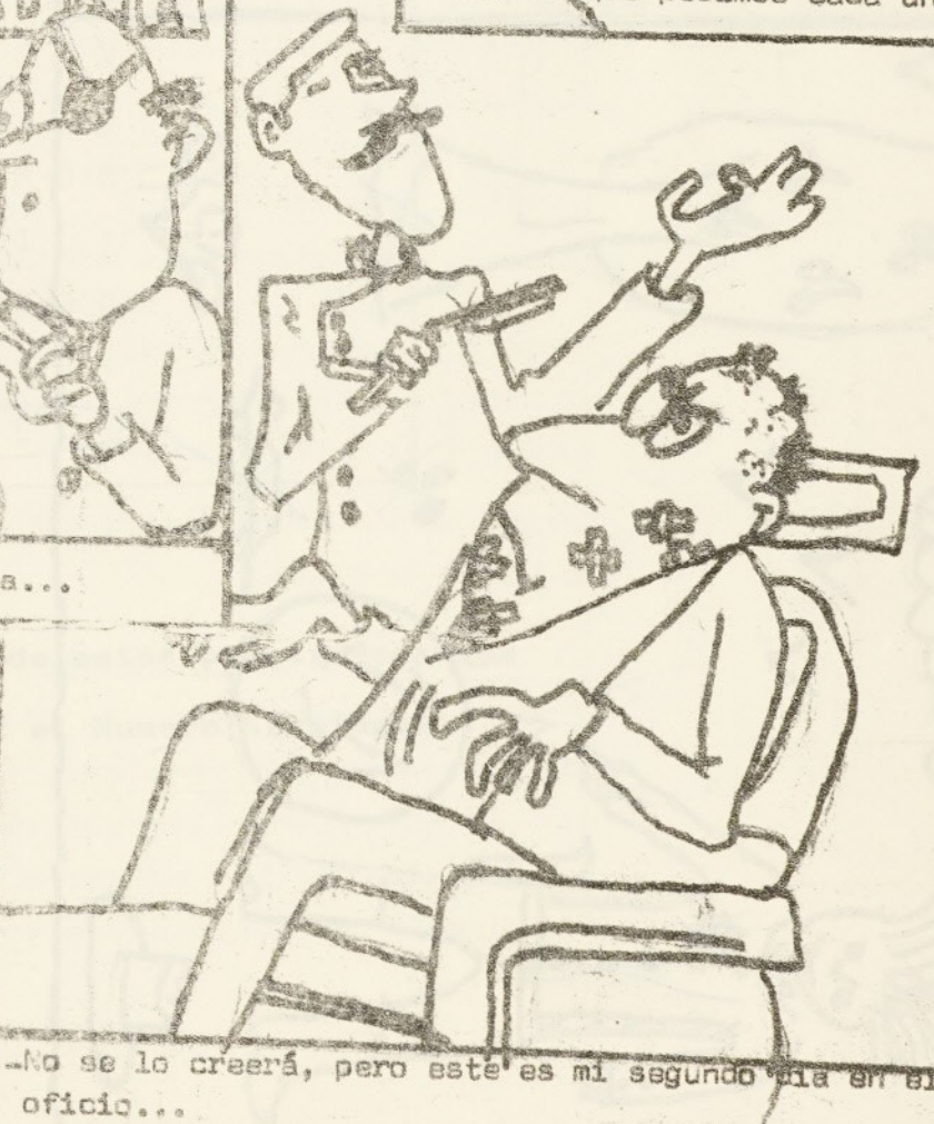
-No se lo creerá, pero este es mi segundo día en el oficio...