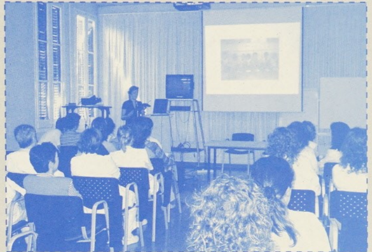
Companys de l'Hospital van explicar la seva experiència al Tercer Món