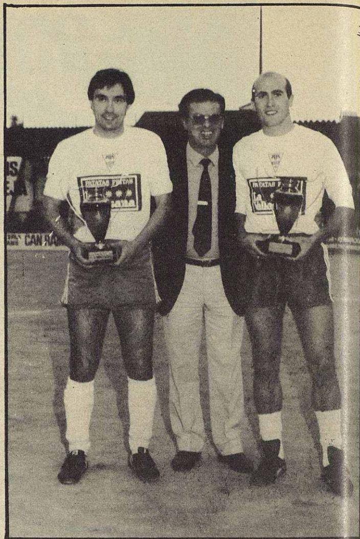
ENTREGA DE TROFEOS "FOTOS ALCALDE"