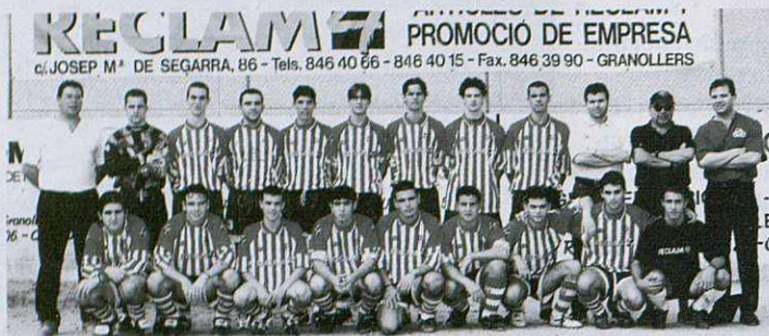
Plantilla del Juvenil del F.C. Cardedeu