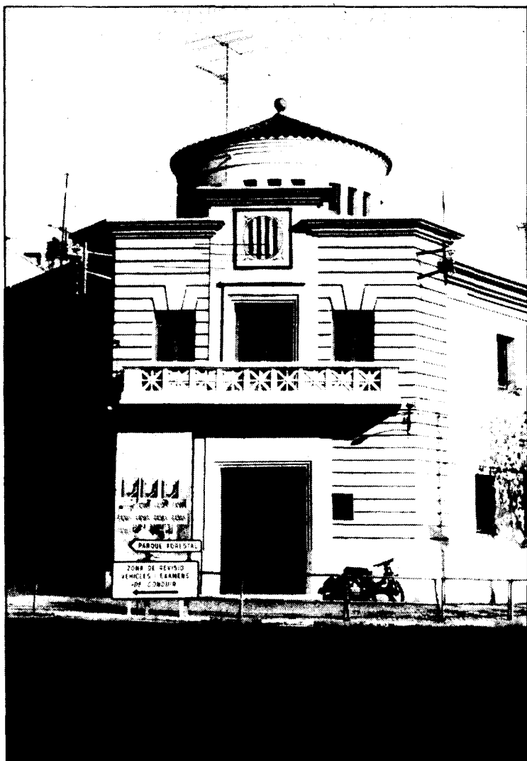
El Casal de la Joventut

Els actes es tancaran el dia 6 de desembre amb un important festival infantil a Cerdanyola, on des del dia 1 de desembre també es faran tot un seguit d'activitats, organitzades pel casal del joves de Cerdanyola.