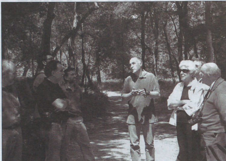
El consejo asesor en un momento de la visita.

El objetivo de la jornada era contribuir a la reflexión sobre