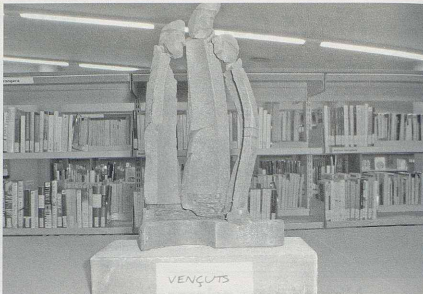
Una obra de l'exposició de Ferran Capdevila.

En Ferran, nascut el 1943 en plena etapa negra de la postguerra, té molt clar què representa no perdre la memòria col·lectiva. Amb aquesta intenció ha fet el seu treball amb restes dels projectils d'aviació trobats, per retre homenatge a les persones que sofriren els horrors d'aquella guerra. És el que ell anomena "una mirada humanista a la Guerra Civil". Una mirada amb peces que tenen nom: "Quinta del biberó", "Refugiats", "Victòria", "Guàrdia de nit", "Presoner" o "Vençuts".