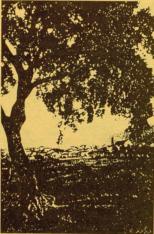
Pista panoràmica