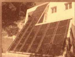
Térmico o fotovoltaico