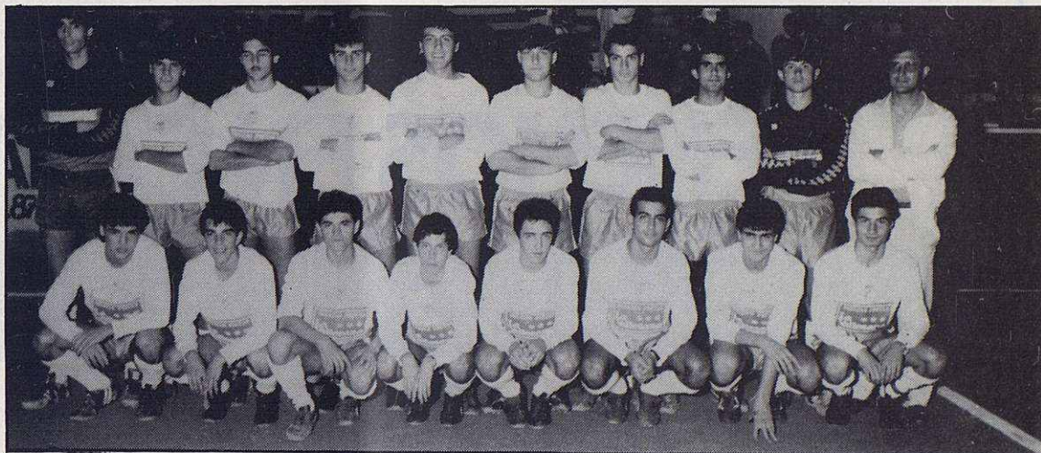
JUVENIL “A” del E.C. GRANOLLERS.- Fotografía tomada en el inicio de la temporada 1985-86. De este juvenil se esperaba mucho pero los resultados no acompañaron a los deseos y pronósticos. De pie de izquierda a derecha vemos a: Jaume, Martínez II, Rubio, Segura, Antonio, Mauri, Garí, Ribó, Monteis, Vilá (entrenador). Arrodillados: Tomás, Martínez I, López, Pérez, Mayol, Pocarull, Espada.