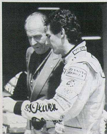
Pedro Martínez de la Rosa acompañó a Juan Carlos I en su visita a los boxes