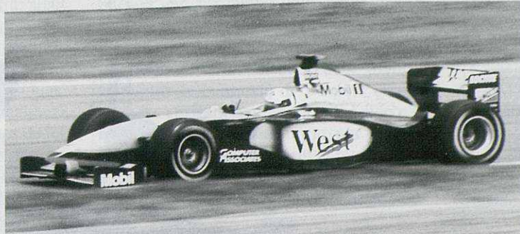
Desde la primera vuelta, los McLaren-Mercedes dejaron patente su superioridad mecánica