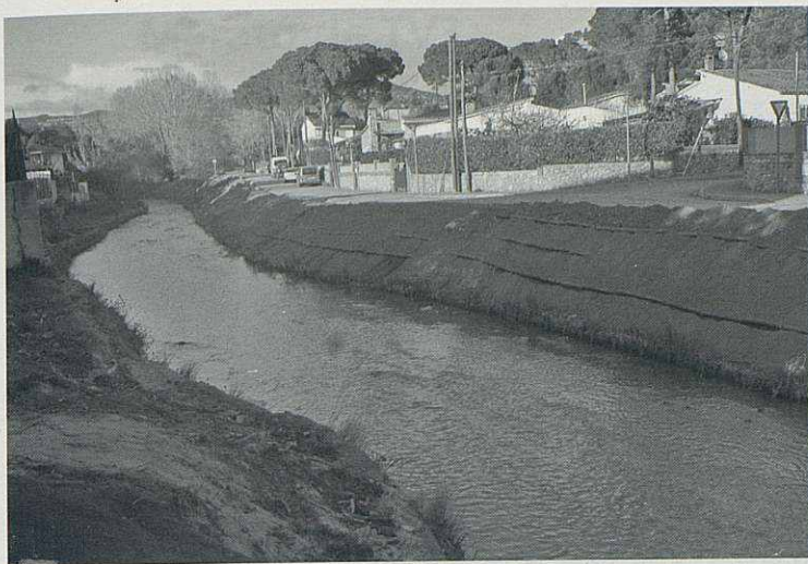
El marge de la llera del Tenes al seu pas pel barri de Can Nomen reperfilats i consolidats.

També es duen a terme actuacions d'estabilització de talussos en marges afectats especialment per processos erosius. En aquest cas es preveu la utilització d'estructures d'estabilització amb tècniques de bioenginyeria com la instal·lació de feixines (feixos de branques vives amb capacitat rebrotadora), d'enfeixinats amb biorotlles vegetals, construcció d'entramats de fusta, mantos orgànics, hidrosembres, etc.