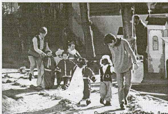
Imatge del pessebre vivent a l'escola bressol.

El dia 21 de desembre es va fer un petit pessebre vivent a l'escola Sol Solet, l'escola bressol de la Roca.