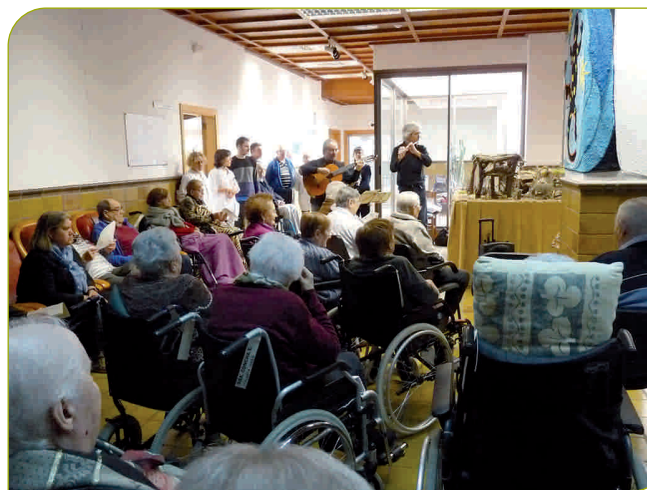
A la residència no hi va faltar la tradicional cantada de nades