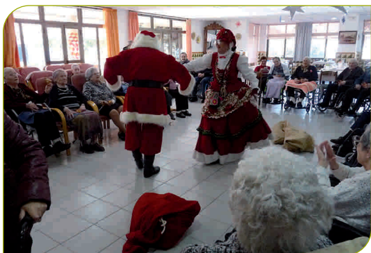
El Pare i la Mare Noel van fer una visita al centre