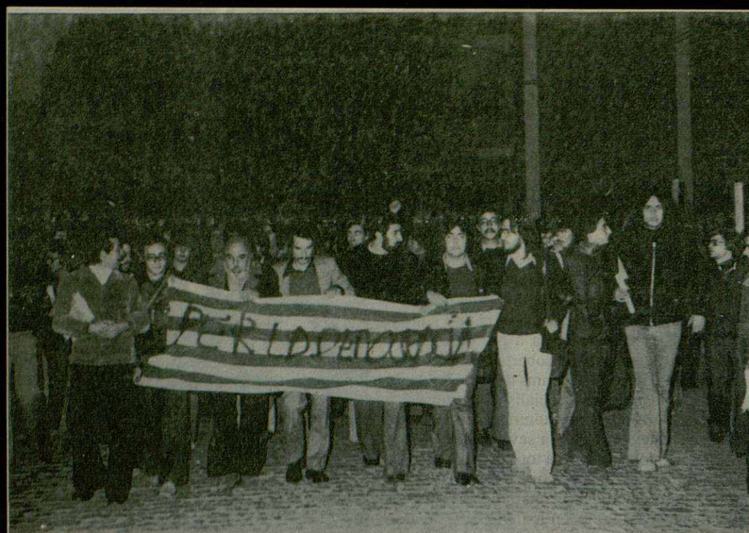
Desde el Pabellón Deportivo hasta la Porxada.