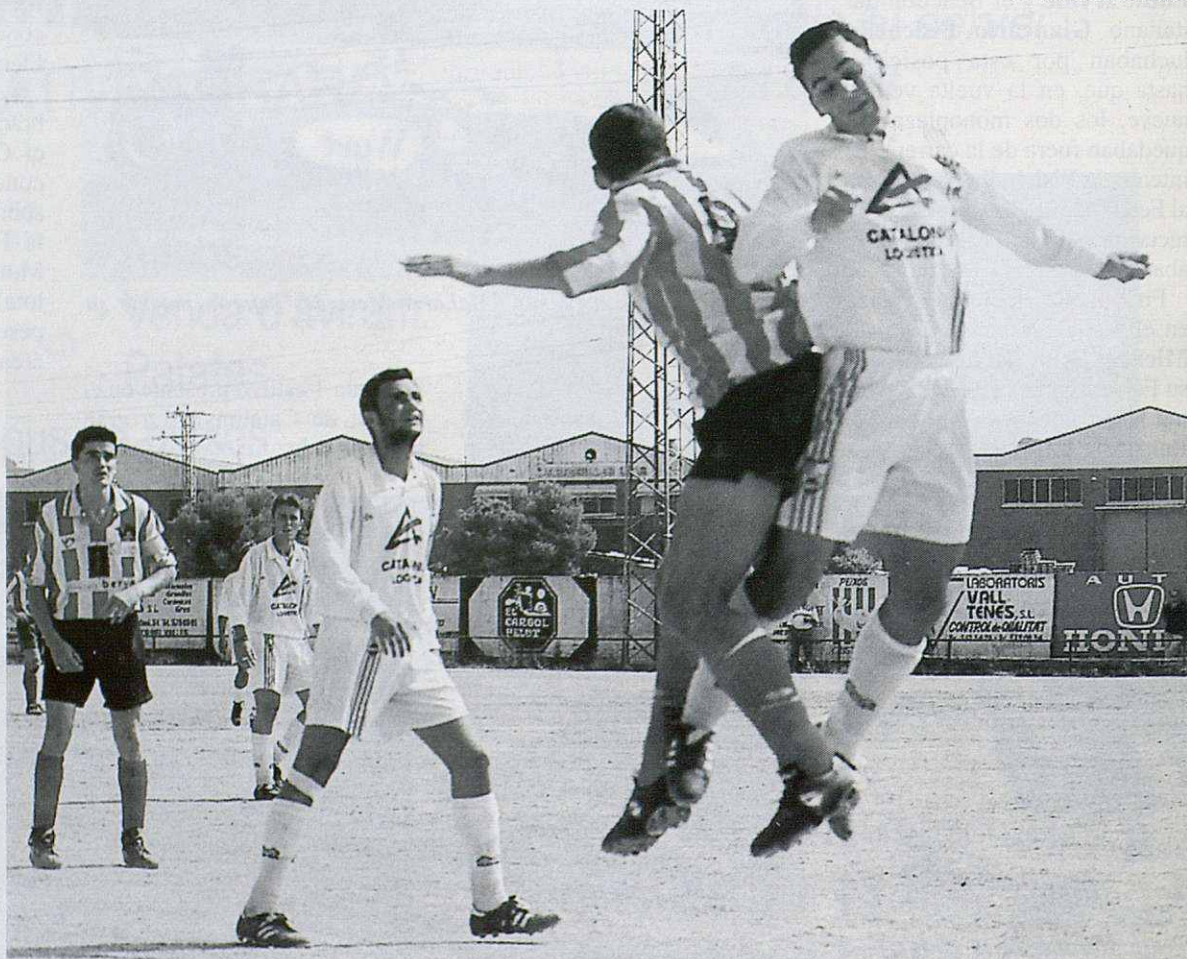
Al camp de futbol de Paret es faran una sèrie de millores