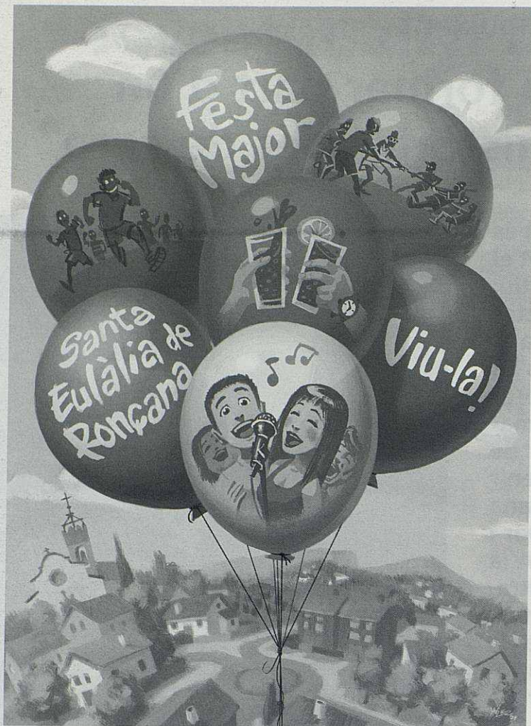
Il·lustració de Xavi Planas, encàrrec per a la Festa Major del 2009.

que és paleta. I em vaig passar un any fent de manobre, a part que ja ho havia fet uns quants estius.