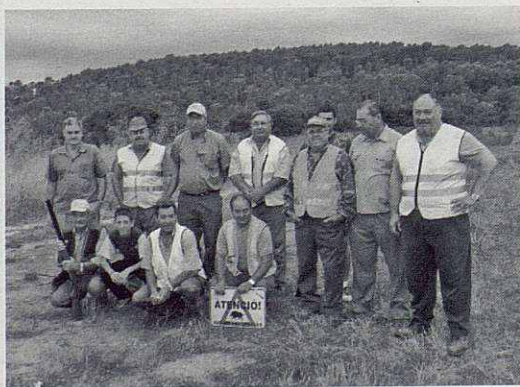
La colla de caçadors apunt de fer una batuda.

Cada centre escolar ha anat realitzant un elevat nombre d'activitats que no caben en aquest espai. Mencionem que l'Escola Bressol Alzina organitza sessions d'Espai Nadó orientatives del primer any de vida; que els alumnes de 5è curs de l'escola la Sagrera van organitzar un procés electoral, en el qual es van formar partits (quatre) i hi van participar alumnes, mestres i personal no docent; que a l'escola Ronçana es va celebrar una tarda de Castanyada molt intensa i que els alumnes de Cicle Formatiu de l'Institut van organitzar una jornada esportiva juntament amb els alumnes d'APINDEP. I ja que parlem d'APINDEP, cal destacar que ja es recullen fruits del treball al camp dels alumnes; per exemple, els moniatos que, en alguns casos arribaren als dos quilos de pes.