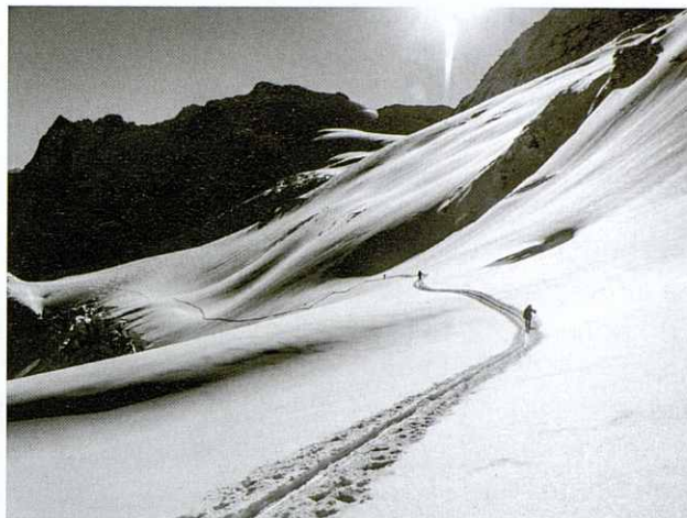
Pujant al coll Tierberglücke de 2.986 m

un descens espectacular baixant per la gelera Zwischen Tierbergen amb una neu pols nova impressionant. Són uns 1.200 m de baixada, que no s'oblidaran fàcilment, fins arribar al fons de la vall al peu de la gelera Triftgletscher (1.850 m). La travessem seguint direcció sud-oest, deixem el llac format pel desglaç de la pròpia gelera a la nostra dreta i comencem la pujada per Trifttälli, per una canal ampla amb molta neu. Tenim els nostres dubtes a seguir