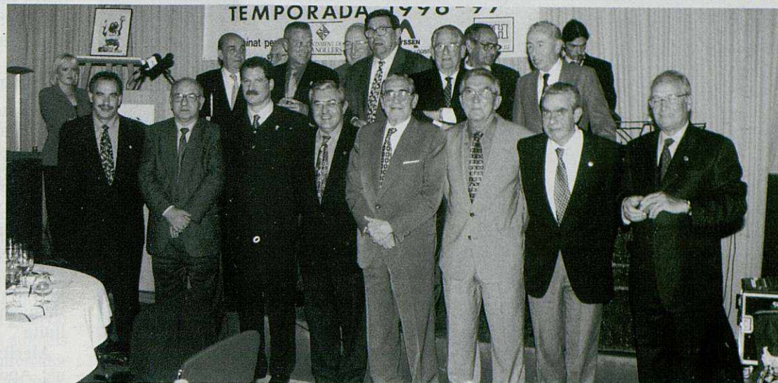
El Club va homenatjar als socis que segueixen fidels a l'entitat des de fa més de cinquanta anys