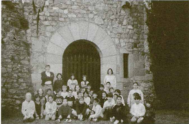
Els alumnes davant la façana del castell.

El passat divendres 20 de març, els alumnes de tercer de primària de l'Escola Pública Pilar Mestres vam anar a visitar el Castell de la Roca.