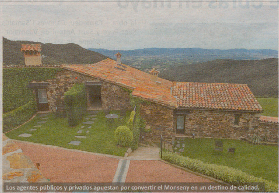
Los agentes públicos y privados apuestan por convertir el Montseny en un destino de calidad.