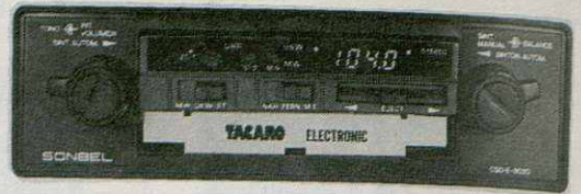
AUTO-RADIO - CASSETTES