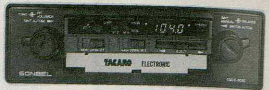
AUTO-RADIO - CASSETTES