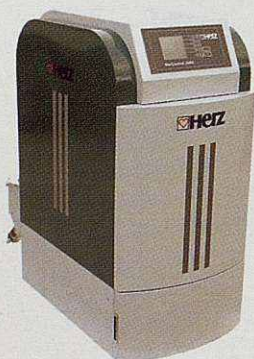
Caldera de biomassa automàtica