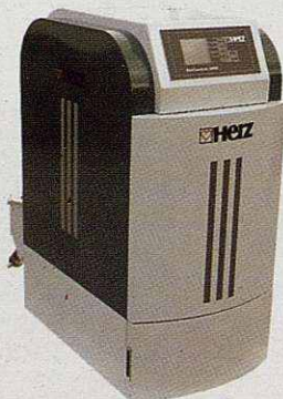
Caldera de biomassa automàtica