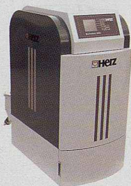
Caldera de biomassa automàtica