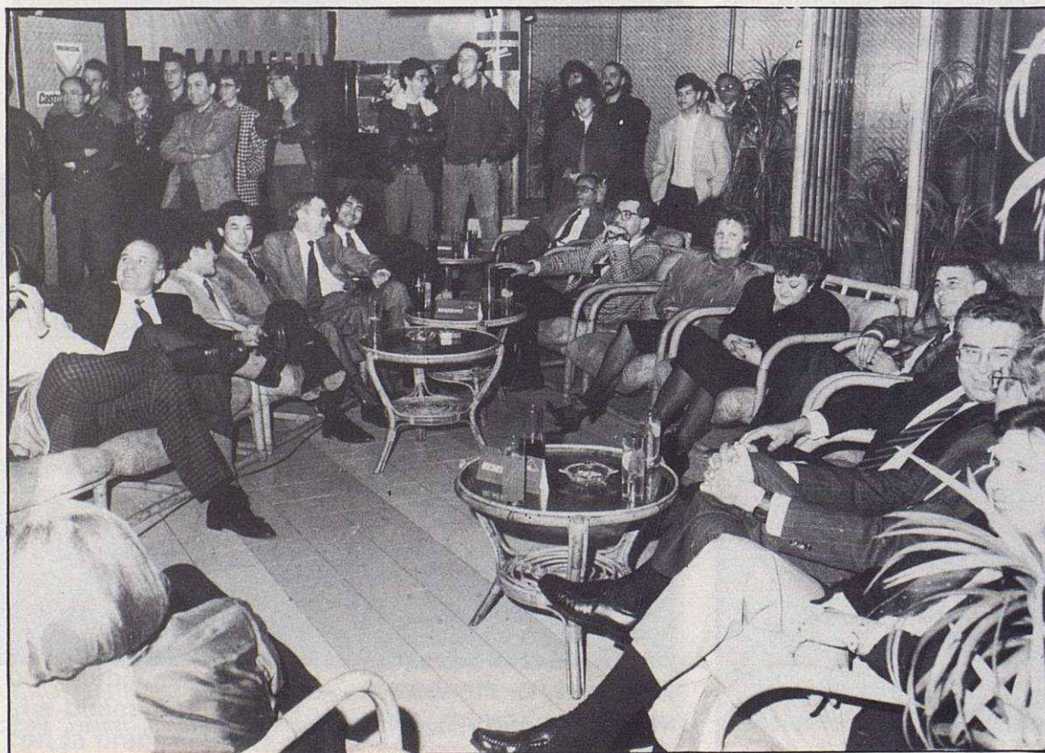
Personalidades y aficionados, asistentes al acto.

El equipo Honda España Competición cumple su quinto año en nuestro país. Durante este tiempo ha ido tomando cuerpo, poco a poco, sin prisas, acumulando experiencias cada temporada, el que es hoy mejor equipo de moto-cross de España en la opinión de la prensa especializada.