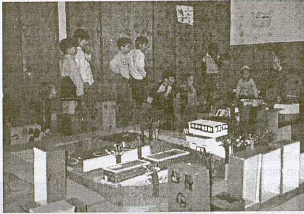
Imatge de la maqueta de la Torreta, construïda per pares i nens.

L'Escola de la Torreta ha comès un esforç encomiable en l'organització de les activitats que com cada any encapçalen la seva Setmana Cultural. Enguany, del vint-i-set al trenta d'abril, el coneixement del barri de la Torreta fou el motiu que presidí totes les tasques emmarcades en la citada Setmana Cultural. L'entusiasme amb què fou acollida la idea entre alumnes i professors junt amb una gran implicació dels pares ha estat la clau de l'exitós resultat, demostrable en la llargalista d'actes celebrats a l'escola. La Direcció de l'Escola de la Torreta va decidir restringir la celebració de la Festa de Sant Jordi tan sols a les aules per tal d'evocar tots els seus esforços a la Setmana Cultural, que aquest any el centre ha volgut dedicar als avis i àvies del barri. L'objectiu dels professors fou, des del primer moment, aconseguir que els alumnes coneguessin millor l'entorn més proper que els rodeja i amb aquest pretext, s'elaborà el contingut d'un estudi a realitzar pels alumnes d'educació infantil i d'educació primària. Els