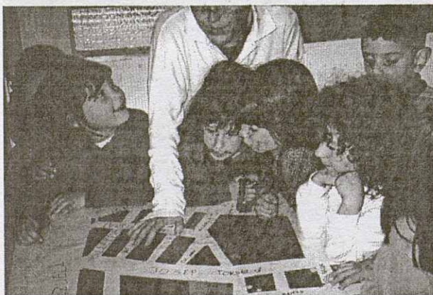
Una mestra mostrant als alumnes els carrers del barri.