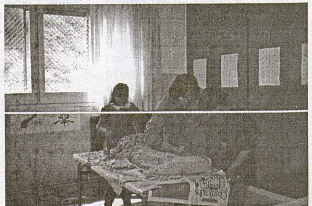
Pintant una maqueta sobre l'entorn natural de la Torreta.