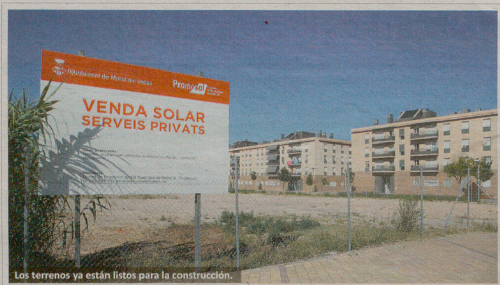
Los terrenos ya están listos para la construcción.