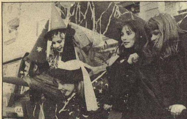
La Rua fue el acto más populoso, se celebró el día 25, domingo. La participación fue numerosa.