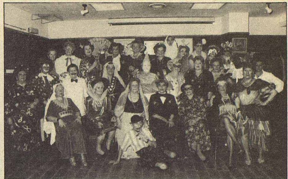
El Splai «Gent Gran» también celebró su particular carnaval. Sin duda fue una fiesta llena de buen humor