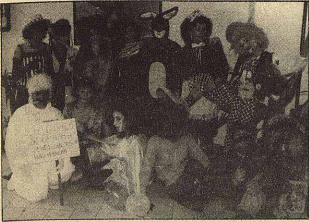
La Academia de Peluquería y Estética JM, celebró como ya es tradicional su propio carnaval entre sus alumnas