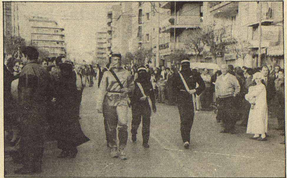
Durante toda la semana de carnaval pudimos ver desde los disfraces más sofisticados hasta los más improvisados