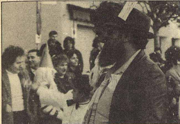
Las parodias sobre las últimas noticias nacionales también aparecieron