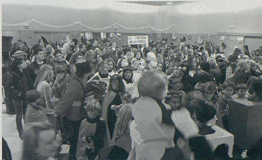
El carnestoltes a La Fàbrica.

Un any més, el grup escènic del Casal Parroquial ha mantingut viva la tradició dels Pastorets ienguany ho va fer amb un afegit. La remodelació de l'escenari, que es va acabar dos dies abans de la primera representació, el dia de Nadal. A més, també es va presentar la nova il·luminació. Pel que fa als actors, es va poder veure