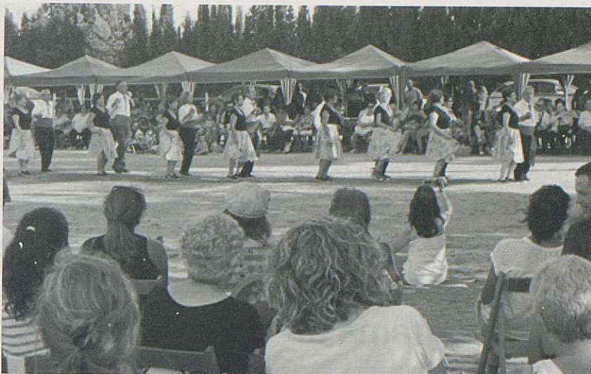
En l'aplec de Sant Simple es va estrenar la colla de gitanes de veterans.

L'Associació Cultural de Granollers està preparant un documental sobre Jaume Arnella, que ressalta la seva tasca en la valoració de la cançó tra-