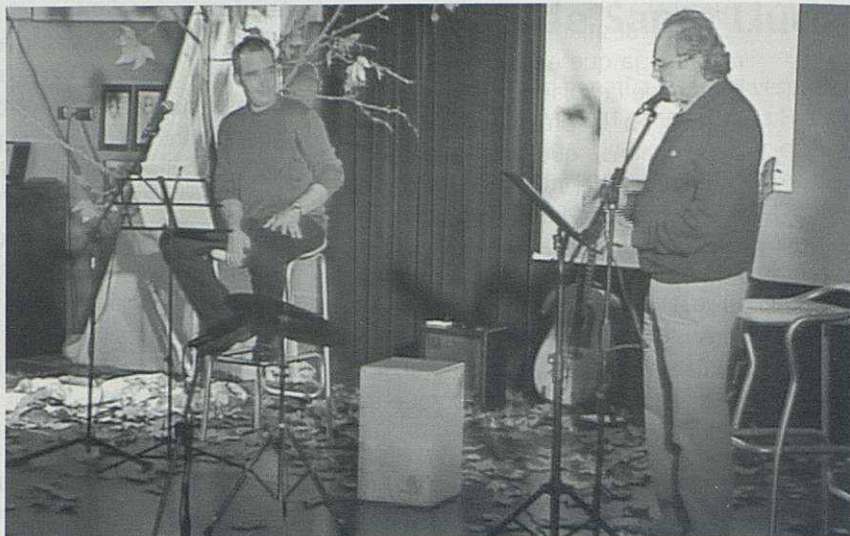
Un moment del recital homenatge a Josep Maria de Sagarra.

Els dies 10 i 11 tinguérem el gruix d'activitats d'enguany