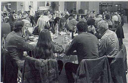
Dinar ofert per la Societat de Caçadors.

Tot plegat una molt bona vetllada pels textos escollits, per la posta en escena i per la lectura i interpretació dels mateixos.