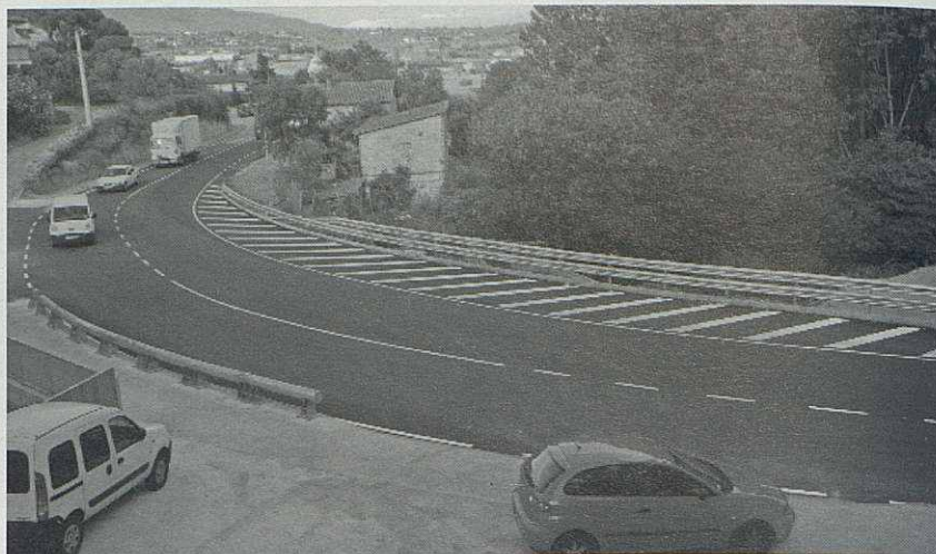
El pont de Can Baró després de les obres d'ampliació de la calçada.

És un bon estiu, amb força calor al pic de juliol però amb algunes pluges intercalades amb certa regularitat que refresquen l'ambient. En el record queda un trist i dantesc esdeveniment del juliol de 1994, és a dir, del de fa vint anys, quan cremaven incontroladament els boscos dels Cingles de Bertí, de Bigues i de Riells en l'incendi més gran que es recorda a les nostres contrades. Serveixin aquestes ratlles per evocar tot el que van fer en aquella ocasió els voluntaris, la gent dels nostres pobles, joves i grans, per aturar les flames.