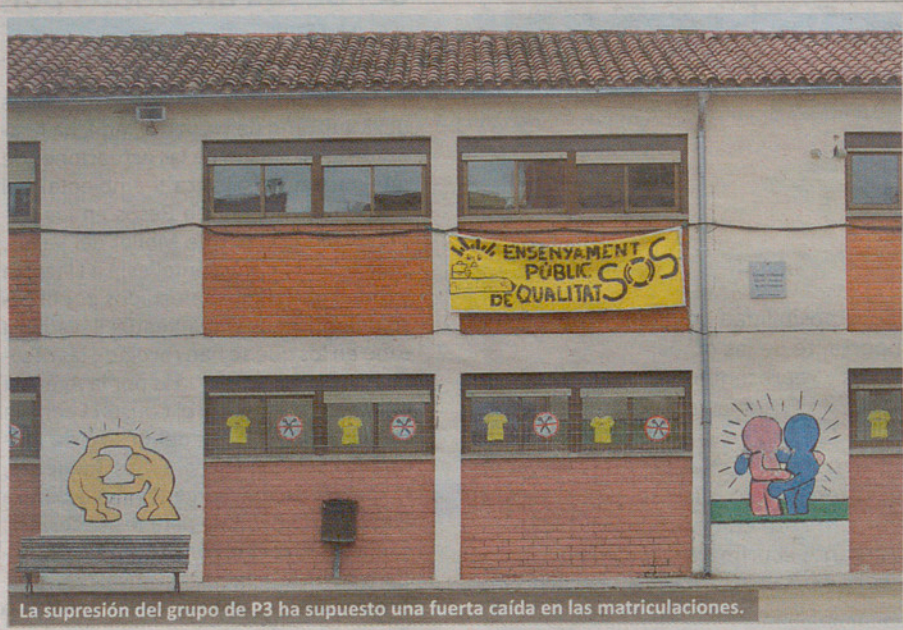
La supresión del grupo de P3 ha supuesto una fuerte caída en las matriculaciones.