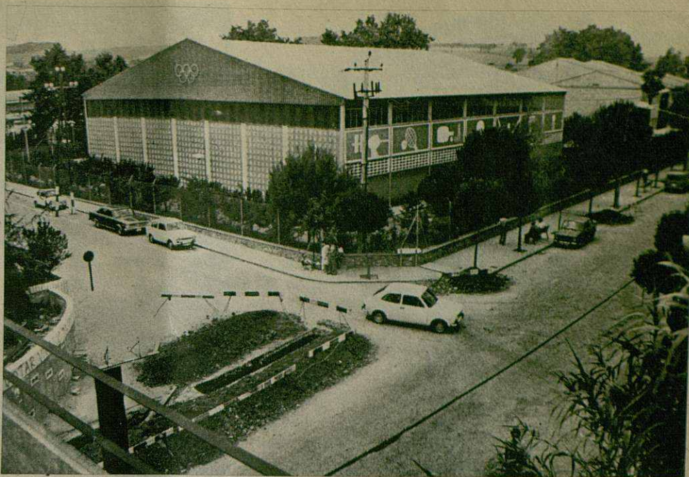
Municipal solo de nombre

Lo realmente denigrante es que en una villa como Mollet del Vallès, poseedora en la actualidad de un número de habitantes que ronda los 40.000, esté tan abandonado el deporte por causa de unos señores —los responsables deportivos— que durante un largo período de tiempo se han desinteresado de la mayoría de las cuestiones que no fueran a revertirles beneficios personales. Por que si en Mollet alguna entidad deportiva funciona de una manera u otra, no es gracias a la labor municipal en este campo, sino a los esfuerzos de una serie de personas que anteponiendo a sus intereses la ilusión y el esfuerzo en una labor comunitaria, han sacado adelante lo poco que en la actualidad sobrevive. Ahí tenemos, sin necesidad de ir más lejos, el caso del C.B. Mollet. El pabellón deportivo de dicho club, que pomposamente exhibe un rótulo en la entrada que reza «municipal», debe su exis-