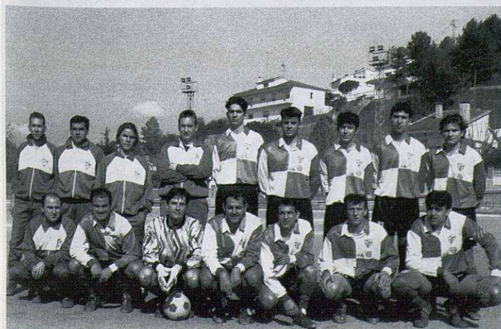
Conjunto de aficionados