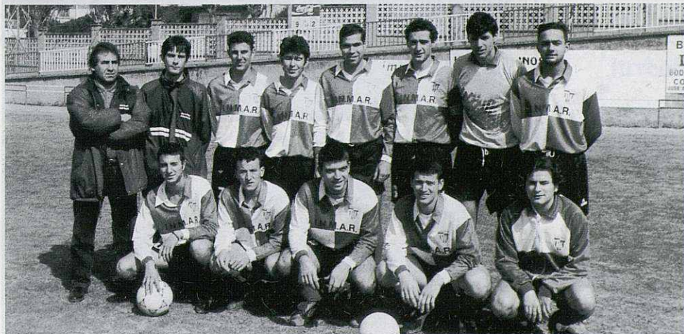
Primer equipo C.F. Martorelles