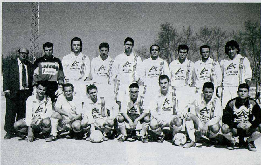
El primer equip del C.F. Parets s'ha mantingut a Primera Regional