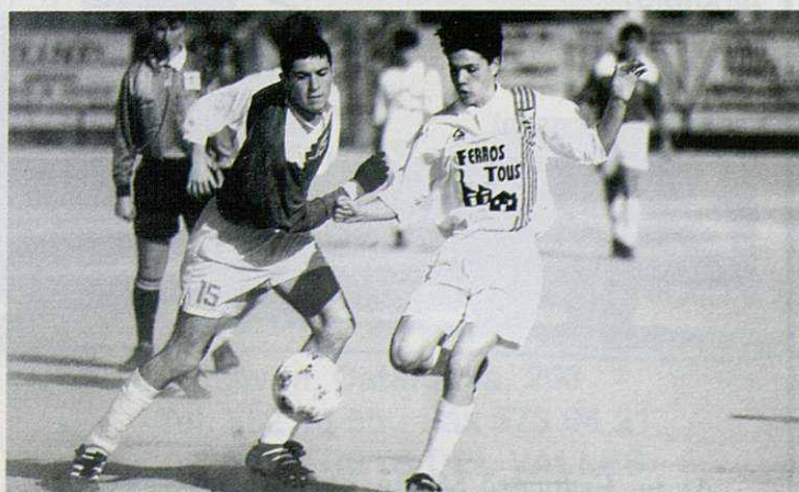
Pujar el Juvenil a 1ª Divisió, un dels objectius